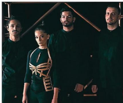
Avec « Cuivre », c'est la dernière soirée pour la Saison cerdane.

La création Cuivre , c'est la rencontre de cinq artistes : trois musiciens polyvalents, une danseuse et un créateur lumière. Ensemble, ils vont exploiter la matière sensible de leur langage et le matériau poétique du cuivre, aux nombreux atouts tant esthétiques, pratiques, que sonores et conducteurs. Paola Maureso, a mis en scène ce spectacle qui offre un voyage d'une femme, dans le temps, au cœur de notre richesse interne, aux frontières du connu et de l'inconnu. Plongée dans son monde à l'intérieur du